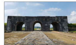
17 TRIỆU ĐẠI NHÀ HỒ (s = 357m2)