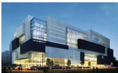
PC MINH HÒA TTTM V+ GIA LAI