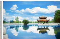
14 LÝ THƯỜNG KIỆT (s = 357m2)