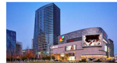
PC MINH HÒA TTTM V+ AN GIANG