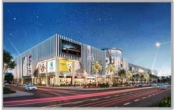
PC MINH HỌA TTT V+ NGHỆ AN