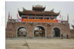
15 TRẦN THÁI TÔNG (s = 357m2)