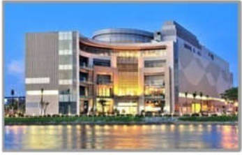
PC MINH HỌA TTT V+ LAI CHÂU