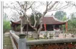
12 LÊ ĐẠI HÀNH (s = 357m2)