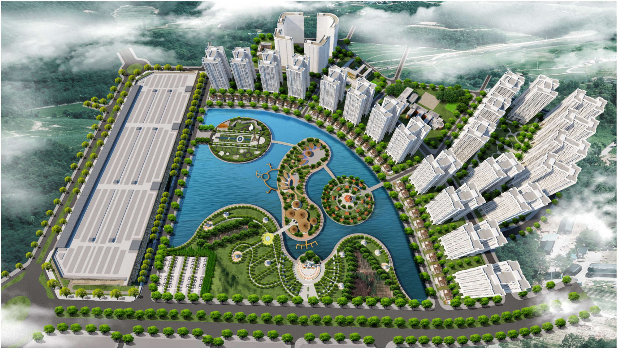
Phối cảnh Tổng mặt bằng dự án