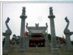
2 LẠC LONG QUÂN (s = 400m2)