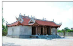
8 TRIỆU VIỆT VƯƠNG (s = 408m2)