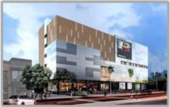
PC MINH HỌA TTT V+ SƠN LA