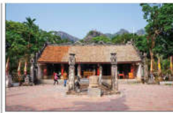
11 ĐÌNH BỒ LÍNH (s = 357m2)