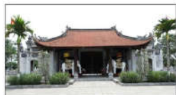
5 HAI BÀ TRUNG (s = 406m2)