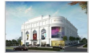
PC MINH HỌA TTT V+ QUẢNG NINH