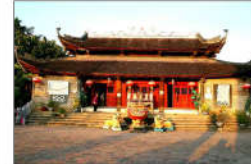
16 TRẦN HUNG ĐẠO (s = 357m2)