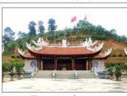
3 VUA HÙNG (s = 406m2)