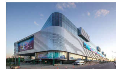
PC MINH HÒA TTTM V+ ĐỒNG THÁP