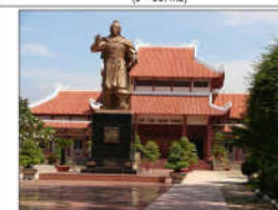
20 TRIỆU ĐẠI TÂY SƠN (s = 357m2)