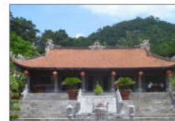
19 ĐỀN NGUYỄN TRÁI (s = 357m2)