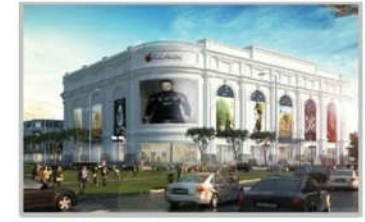
PC MINH HỌA TTT V+ HÀ GIANG, CAO BẰNG