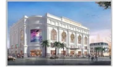
PC MINH HỌA TTT V+ QUẢNG TRỊ, HÀ TĨNH