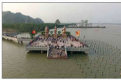
10 NGÔ QUYÊN (s = 357m2)