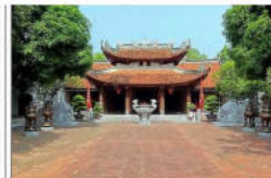
13 LÝ CÔNG UÂN (s = 357m2)