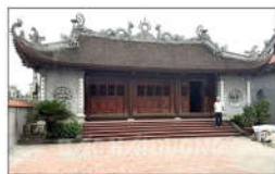
9 PHÙNG HUNG (s = 300m2)