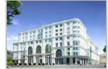
PC MINH HỌA TTT V+ BẮC CẠN, LẠNG SƠN