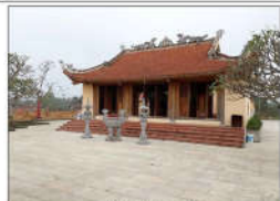
7 LÝ NAM ĐỀ (s = 406m2)