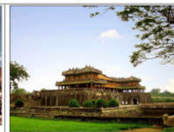
21 TRIỆU ĐẠI NHÀ NGUYỄN (s = 357m2)