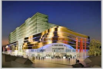
PC MINH HỌA TTT V+ ĐIỆN BIÊN