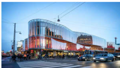
PC MINH HÒA TTTM V+ TÂY NINH