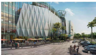
PC MINH HÒA TTTM V+ KONTUM