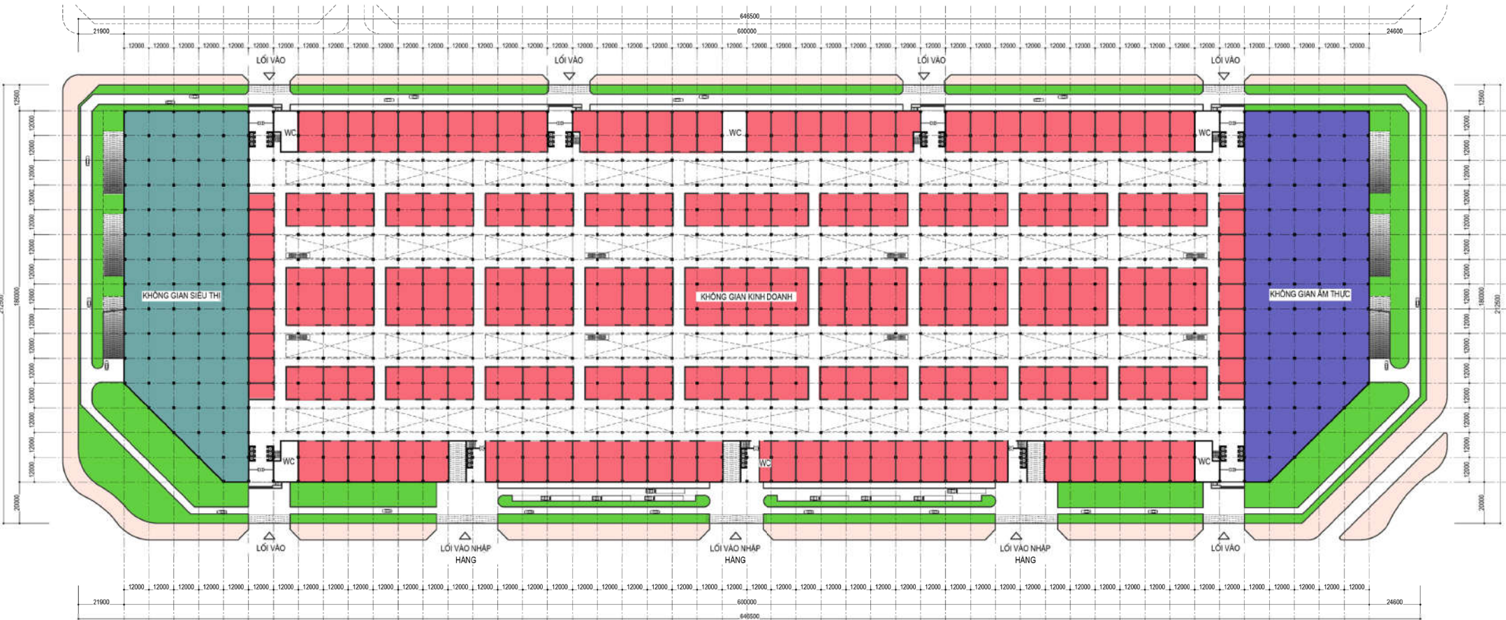
MẶT BẰNG TẦNG 1 DIỆN TÍCH SÀN : 105.860 M2