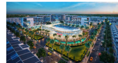
PC MINH HÒA TTTM V+ KIÊN GIANG