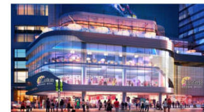
PC MINH HÒA TTTM V+ BÌNH THUẬN