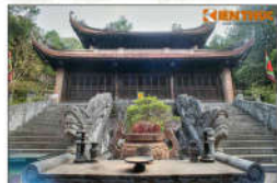
6 BẢ TRIỆU (s = 406m2)