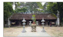
18 ĐỀN LÊ LỢI (s = 357m2)