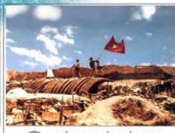
22 THỜI ĐẠI HỒ CHÍ MINH (s = 1000m2)