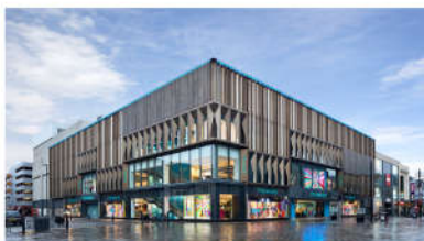
PC MINH HÒA TTTM V+ BÌNH PHƯỚC