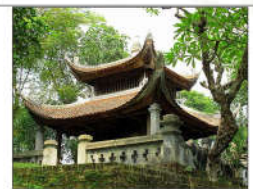
4 AN DƯƠNG VƯƠNG (s = 406m2)