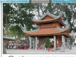
1 ĐỀN KINH DƯƠNG VƯƠNG (s = 1135m2)