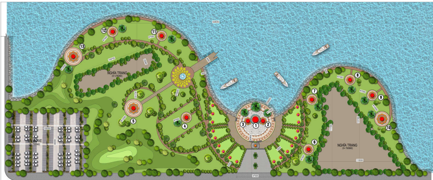
KHU TÂM LINH PHẬT PHÁP ( 58000 M2)